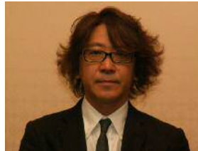
後藤田中央執行委員