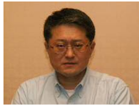
直田中央執行委員