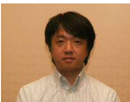
金井前中央執行委員