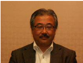
本古前副事務局長