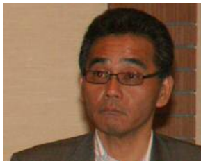
松本特別中央執行委員