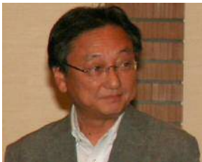
傳田特別中央執行委員