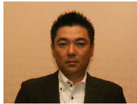
又吉中央執行委員