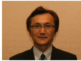
小仲中央執行委員