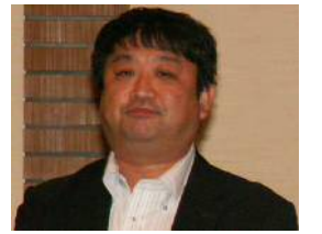
藤井特別中央執行委員