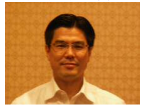
岩堀中央執行委員