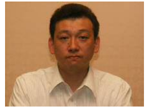
中谷中央執行委員