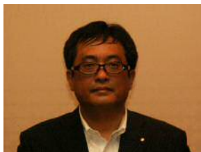
山口前中央執行委員