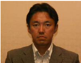
杉崎前副事務局長