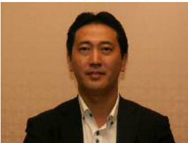
上原前中央執行委員