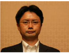
藤枝中央執行委員