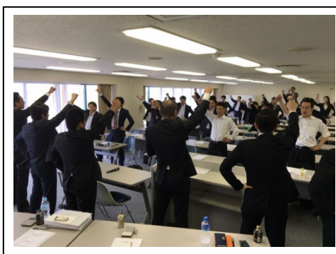
組織拡大にむけた団結

各支部役員による精力的な説明により目標としていた 8 割を超える方からの賛同を得ることが出来ました。この結果を背景に 2016 春季生活闘争にて、契約社員のユニオンショップ化について要求を行い、交渉を重ねた結果、2016 年 4 月より一般型契約社員をユニオンショップにて組織化することが出来ました。