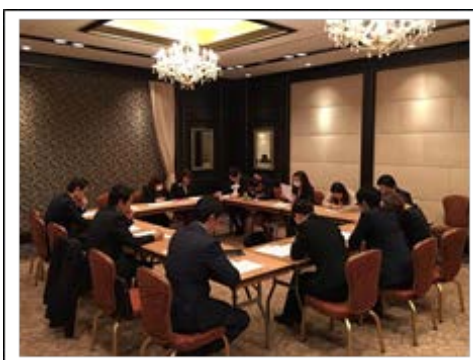
各支部での学習会の様子

当社で働く従業員の力が十分発揮できる職場環境にするためにも、組合活動についてご理解をお願い申し上げます。