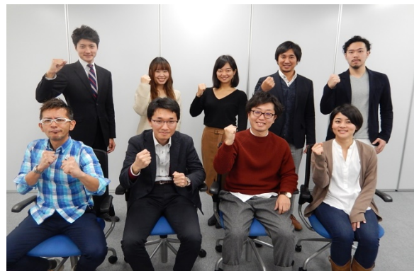
JTBパブリッシング労組執行部の皆さん

現在、会社は出版事業に依存した体制から新しい事業領域への進出に取り組んでおり、JTBグループ各社との関わりも増え、サービス・ツーリズム産業の動向や政策が、会社における事業、ひいては働き方や労働条件にも今後ますます影響を及ぼしていくと執行部は考え、「更なる組織基盤の強化にむけ、活動の“幅”を拡げていきたい」と、サービス連合への加盟（2016年9月）を決断しました。