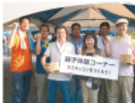
2012年、連合エコ大賞受賞者の取り組み写真