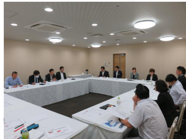
ホテル・旅館業委員会