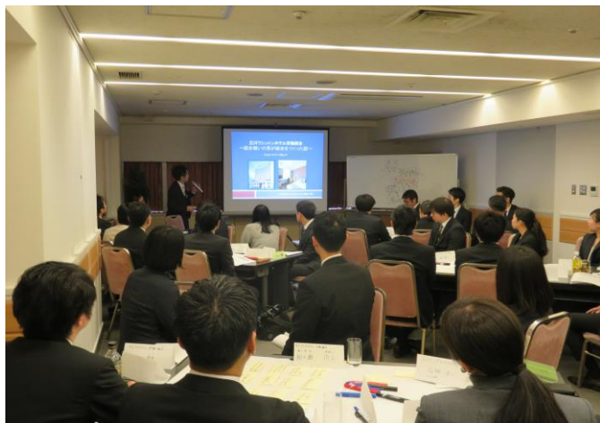
観光・国際貨物委員会