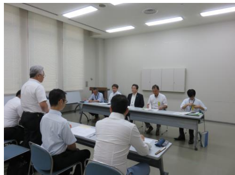
国土交通省関東運輸局 部会交渉