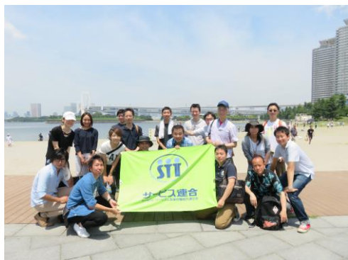
社会貢献活動（海岸清掃活動）