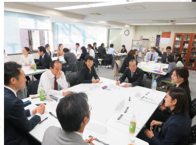
ウェディングプランナー交流会