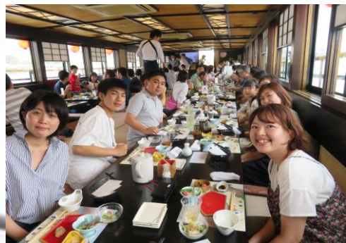
首都圏レクリエーション（屋形船）