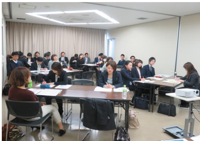
旅行業委員会・若手組合員交流会