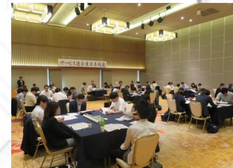
合同拡大代表者会議 学習会