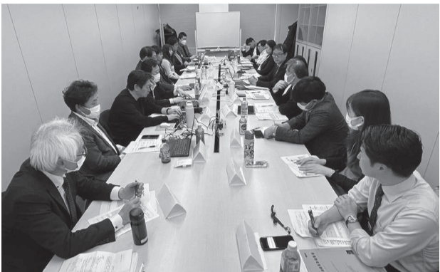
東日本ブロック(ツーリズム)