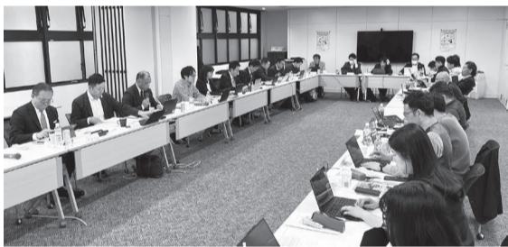
2026春季生活闘争 第2回闘争委員会