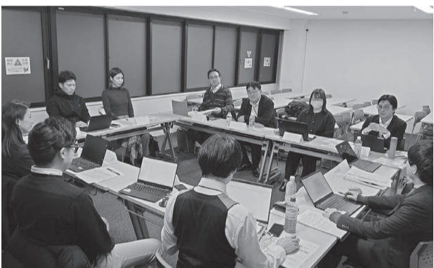
中部ブロック(フォワード)

ら「いずれれ亡くなる命であれば、自分の人生を困った人の救済にささげたい」と自ら神戸のスラム街に移り住みます。そこで、無料診療所や、簡易宿泊所、職場相談所、「膳飯屋」「天国屋」などを開業し、弱者救済に奔走しました。やがて、留学のためアメリカに渡った際に、労働組合のデモ行進を目的に「救済」だけでは限界がある。労働者が団結して社会の仕組みを変えていかななくてはならない」と思い、帰国後は労働組合や日本農民組合の設立に関わり、労働者の権利や農民の地位向上を指導しました。また、協同組合運動・生協の設立にも携わり