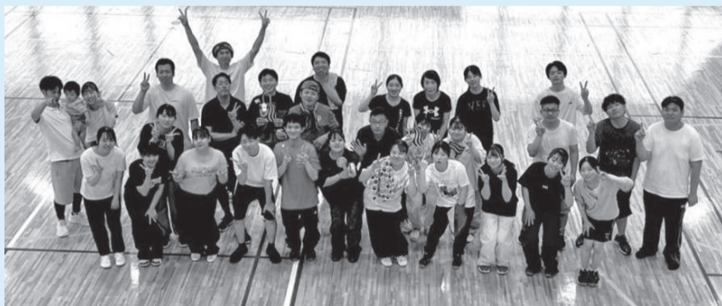
レクリエーション活動の様子

伊勢志摩の魅力は国内外へ発信し、訪れる人々と地域をつなぐ架け橋となること。それが伊勢志摩リゾートマネジメントの使命です。これからも地域とともに、新たな価値を創造し続けてまいります。三重県に旅行に來られた際はぜひ、お立ち寄りください。