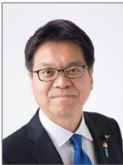
比例代表 浜口誠氏 国民民主党