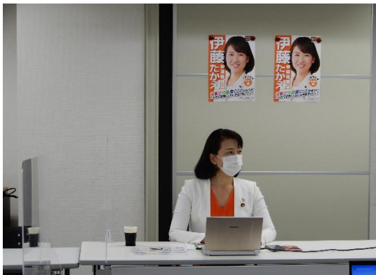
伊藤孝恵参議院議員