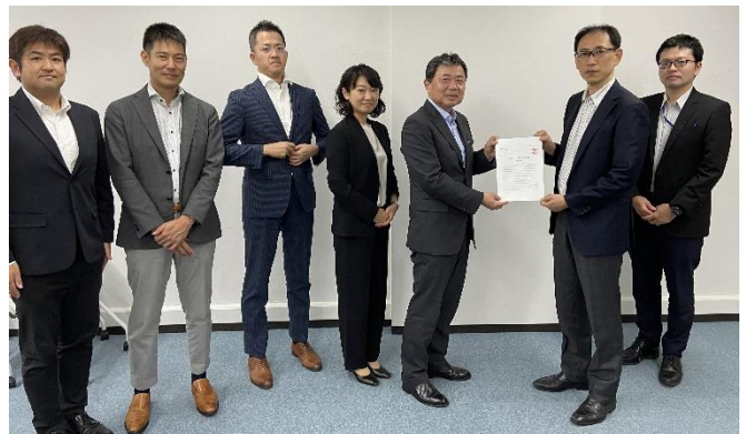
財務省（関税局）へ要請書の手交をおこなう様子

サービス連合は今年3月に策定した「2023年度 サービス連合の重点政策」の実現に向け、各政党および関係省庁に対し、要請をおこなっています。