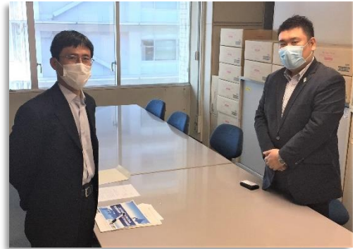
九州経済産業局を訪問し、緊急要請の趣旨を説明する菌田議長（右）