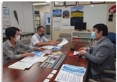
福岡県商工部観光局を訪問し、緊急要請の趣旨を説明する菌田議長（右）